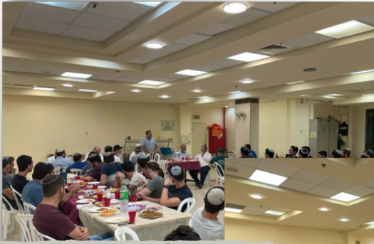
מסיבת פרידה משנה ה'