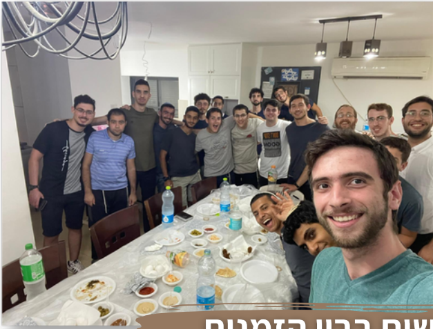
נפגשים בין הזמנים