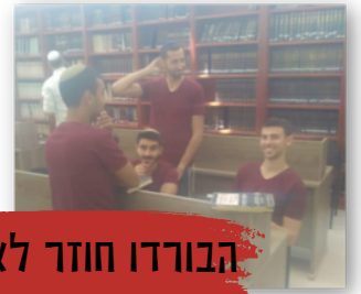
הבורדו חוזר לאופנה