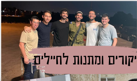
ביקורים ומתנות לחיילים