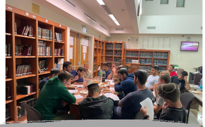
משמר לראש השנה