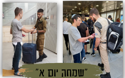
"שמחה יום א"