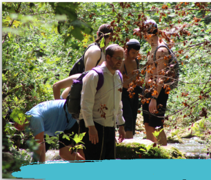
טיולים של שנה א ושנה ב