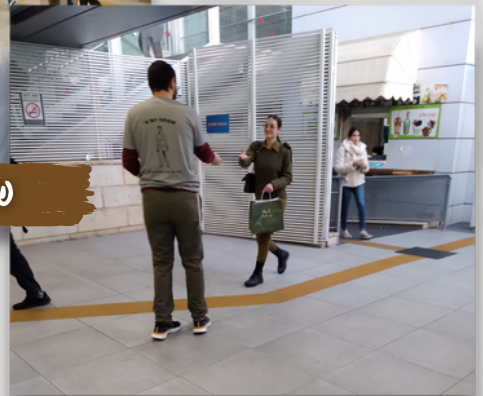
שמחה יום א'