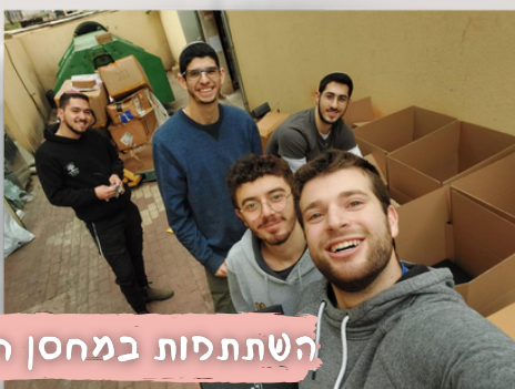
השתתפות במחסן הסד