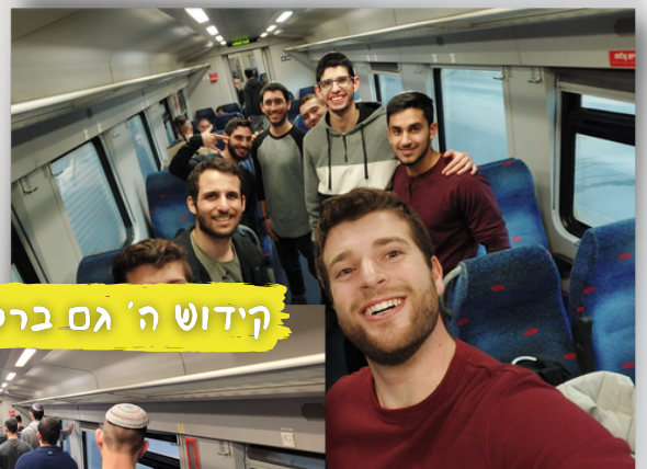
קידוש ה' גם ברכבת!