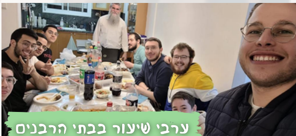
ערבי שיפור בבתי הרבנים